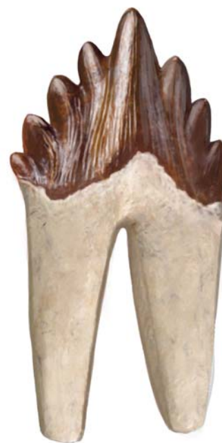
ЗУБЫ БАЗИЛОЗАВРА БЫЛИ РАЗМЕРОМ С НАШУ ЛАДОНЬ.

Возможно, они были первыми китами, которые полностью порвали с сушей и никогда не выползали на берег.