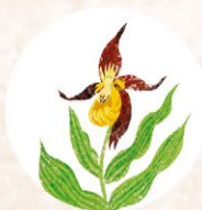
Венерин башмачок настоящий