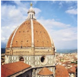
ДЕВЯТЫЙ ЯНУАРИЙ 1616 ИЮБИЛЕЙ 17 ВОЗРОЖДЕНИЕ 26 ПОСЛЕДОВАТЕЛЬНОСТЬ 23 ПАНТЕОН 60 ИВАНОВА 42 КОЛОДЦА СКАЛЫ 48 САХАРОВАТЫЙ ДОМОМОНАХ 48 СОСТАВ ДИЗАЙНА 95

Купол — это архитектурное сооружение, развившееся из арки и впервые появившееся в древности на Ближнем Востоке, в Индии и Средиземноморье. Первые профили куполов обнаружены на стенах и гробницах, но первые примеры научились возводить большие куполы, такие как Пантеон. Купол играет большую роль в раннехристианской и византийской архитектуре. Чтобы обеспечить свет для купола на квадратном основании, византийские архитекторы изобрели так называемые барабаны. Такая конструкция широко использовалась в храме Возрождения и в барочной церкви, когда архитекторы экспериментировали с разными формами дварных структур — от выходящих до вогнутых глав. Последние