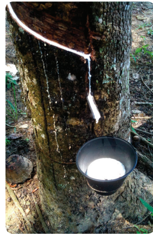
Каучуковое дерево Hevea brasiliensis .

Сегодня тонна каучука стоит 4000 долларов, что в два раза дороже, чем в начале XX века. То есть номинальная цена выросла вдвое. Но зарплаты с тех пор выросли в 100 раз. Можно констатировать, что технологический прогресс привел почти к пятидесятикратному падению дей-