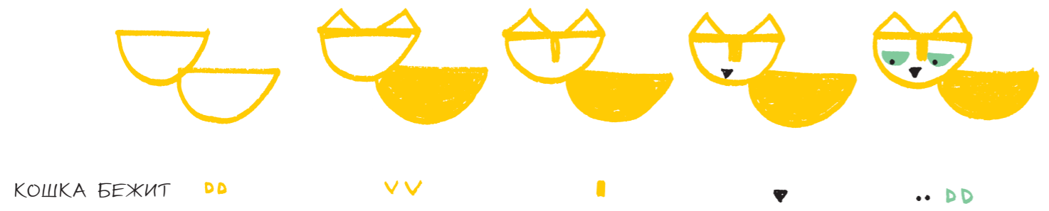
КОШКА БЕЖИТ DD