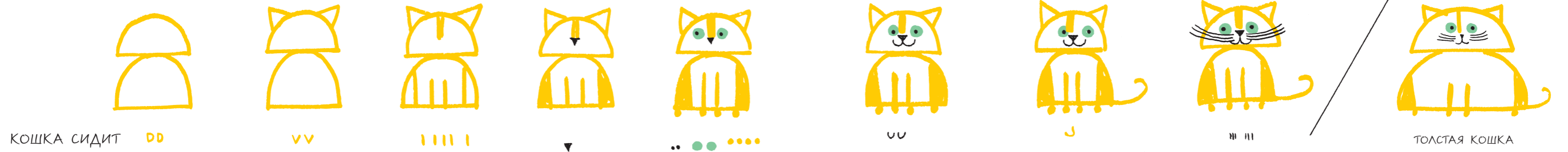
КОШКА СИДИТ DD