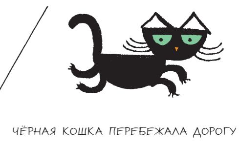
ЧЁРНАЯ КОШКА ПЕРЕБЕЖАЛА ДОРОГУ