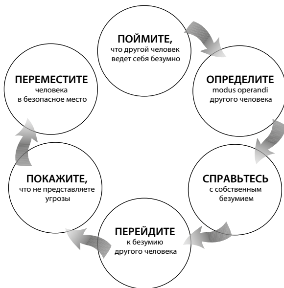
Рис. 1.1. Цикл благоразумия

Я собираюсь научить вас работать с безумием совершенно иначе, используя шестиступенчатый процесс. Я называю его «циклом благоразумия» (рис. 1.1).