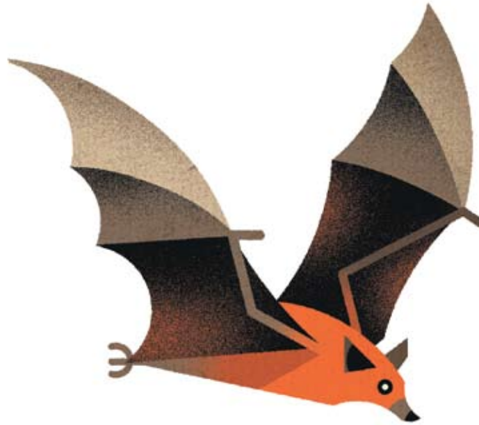
Гигантская летучая лисица // Pteropus vampyrus