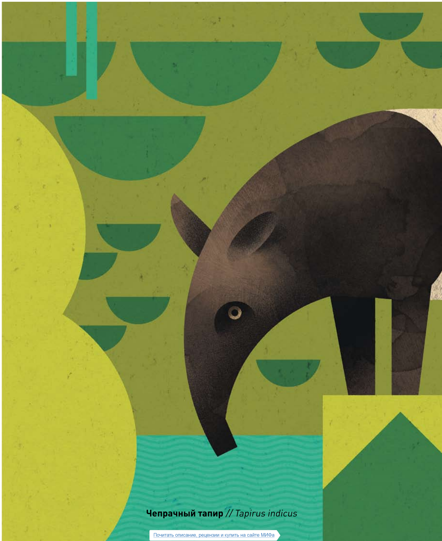
Чепрачный тапир // Tapirus indicus

Почитать описание, рецензии и купить на сайте МИФа