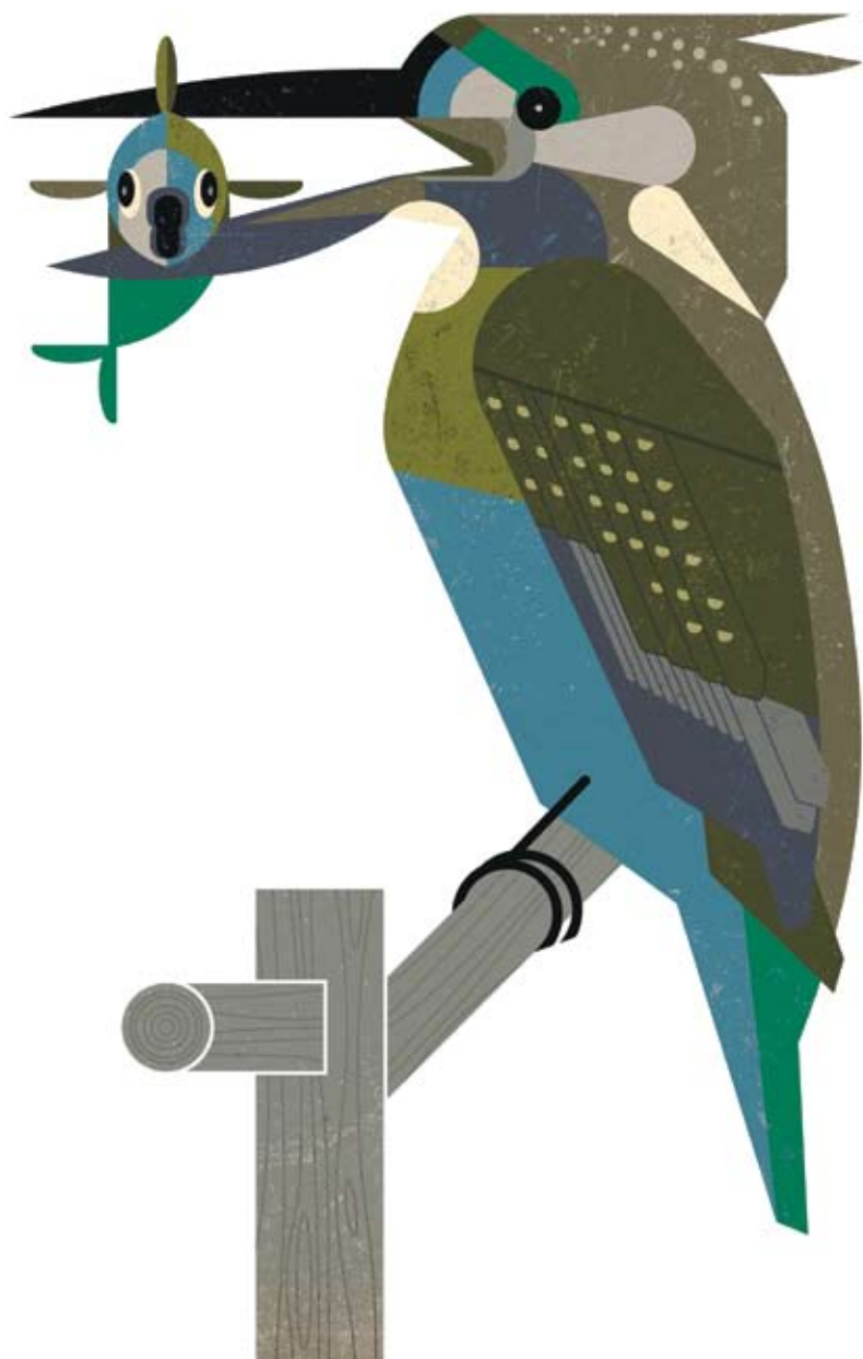
Обыкновенный зимородок // Alcedo atthis