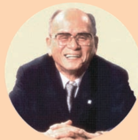
г-н Тору Кумон, основатель Kumon