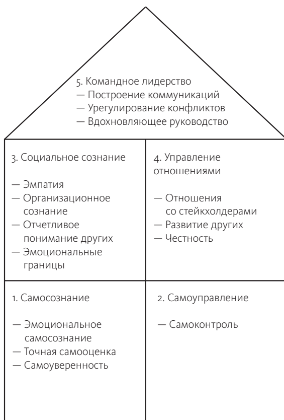
Рис. 2.4. Система эмоционального интеллекта для проектного менеджмента

общую систему, чтобы она больше соответствовала потребностям проектных менеджеров. Я взял за основу самые релевантные аспекты этой модели, применимые к проектам и проектному менеджменту, и добавил другие компетенции и факторы, имеющие значение для специалистов в нашей области. Конечная система показана на рис. 2.4. Она была изменена, чтобы сконцентрировать внимание на самых релевантных концепциях эмоционального интеллекта для проектных менеджеров и показать применение этих концепций. Ниже изложена краткая информация о различиях между общей моделью и моделью с акцентом на проектный менеджмент.